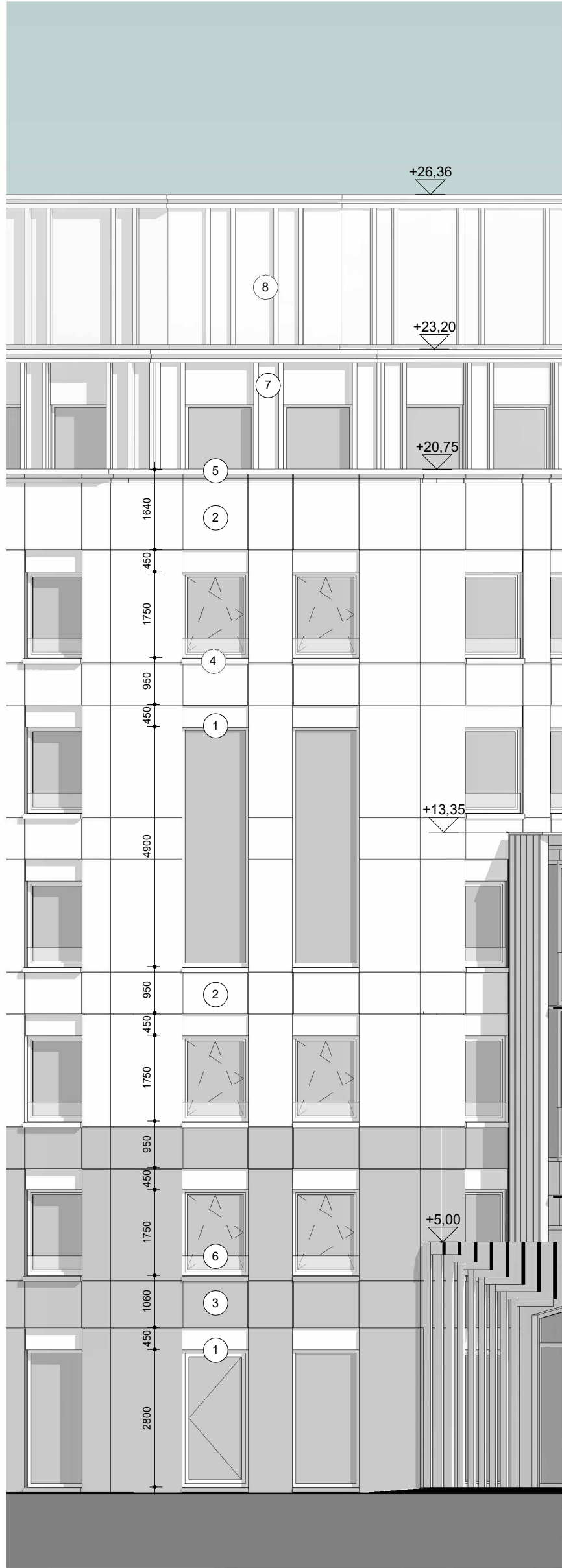
Gevel Noordwest 3 - nieuw